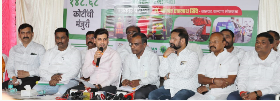
अंबरनाथ, बदलापूर आणि उल्हासनगरचा संयुक्त प्रकल्प