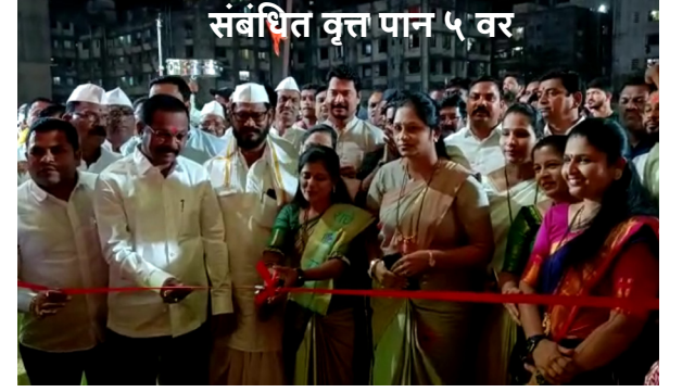
संबंधित वृत्त पान ५ वर.

► वर्ष-२ ■ अंक-२१ ■ epaper.diwanews.com ■ सोमवार, २६ डिसेंबर २०२२ ■ पाने-८ ■ किंमत ४ रु. RNI No.-MAHMAR/2021/80669