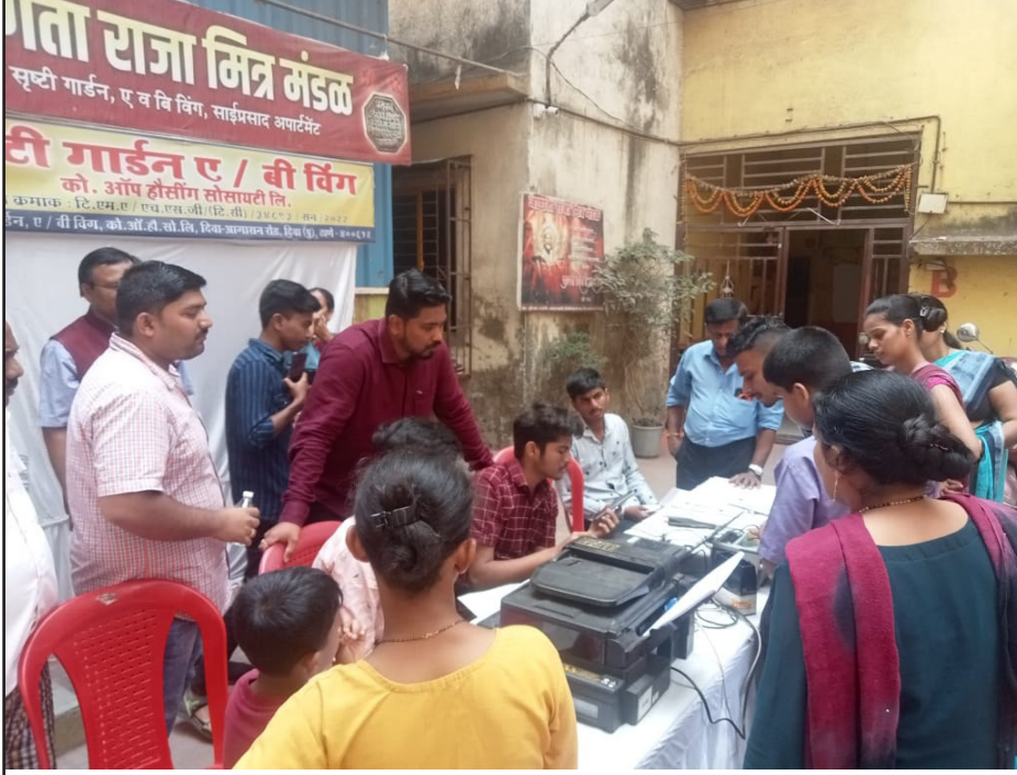
जाणता राजा मित्र मंडळच्या नुकतेच आधार कार्ड, मोफत आरोग्य तपासणी शिबिर आयोजित करण्यात आले होते.या आरोग्य शिबिराला नागरिकांनी चांगला प्रतिसाद दिला.