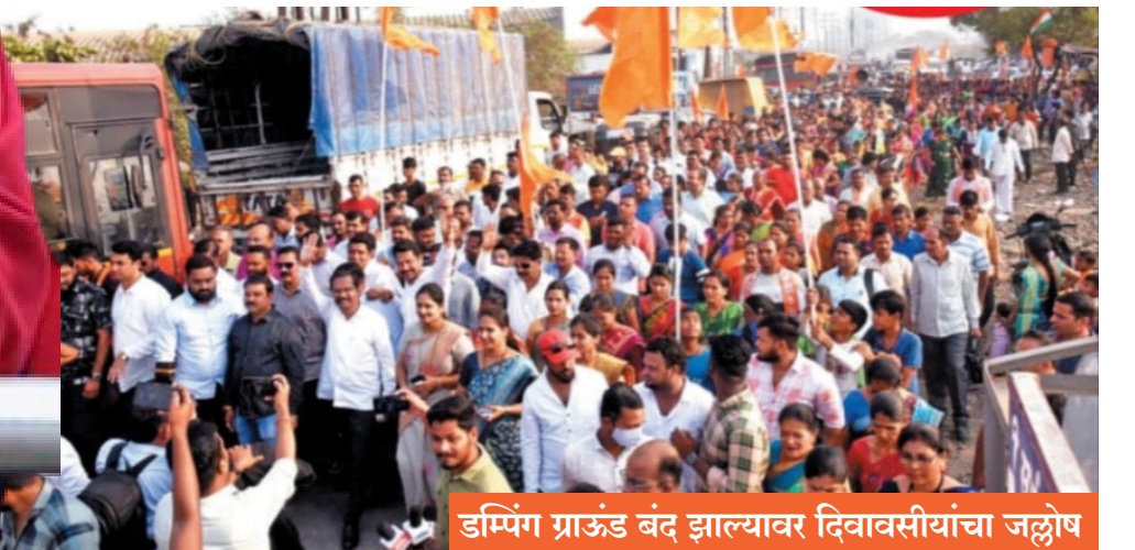
डम्पिंग ग्राउंड बंद झाल्यावर दिवावासीयांचा जल्लोष

ठाणे महापालिकेने डंपिंग ग्राउंडसाठी भंडार्ली येथील जागा ताब्यात घेतली असून भंडार्ली येथील जागा ही नागरी वस्तीपासून दूर असून या ठिकाणी टाकण्यात येणाऱ्या कचऱ्याचे शास्त्रोक्त पद्धतीने विघटन करण्यात येते.