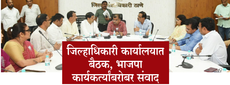
जिल्हाधिकारी कार्यालयात बैठक, भाजपा कार्यकर्त्यांबरोबर संवाद

ठाणे : राज्याचे सार्वजनिक बांधकाम मंत्री रविंद्र चव्हाण यांनी शुक्रवारी ठाणे शहराचा दौरा करून शहरातील समस्यांचा आढावा घेतला. त्याचबरोबर भाजपाचे पदाधिकारी व कार्यकर्त्यांबरोबर संवाद साधला. तसेच जिल्हाधिकारी कार्यालयात विशेष बैठक घेऊन विविध समस्यांसंदर्भात योग्य कार्यवाही करण्याचे निर्देश महापालिका व महसूल विभागाच्या अधिकाऱ्यांना दिले.