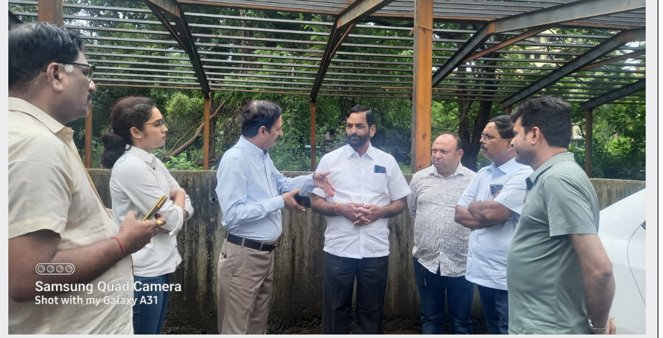
Samsung Quad Camera Shot with my Galaxy A31

या योजनेसाठी डॉ.मूस मार्गालगतचा नाला निवडण्यात आला. अंदाजे ३००फूट लांब आणि ३० फूट रुंद नाल्यावर आधुनिक पद्धतीने आवरण