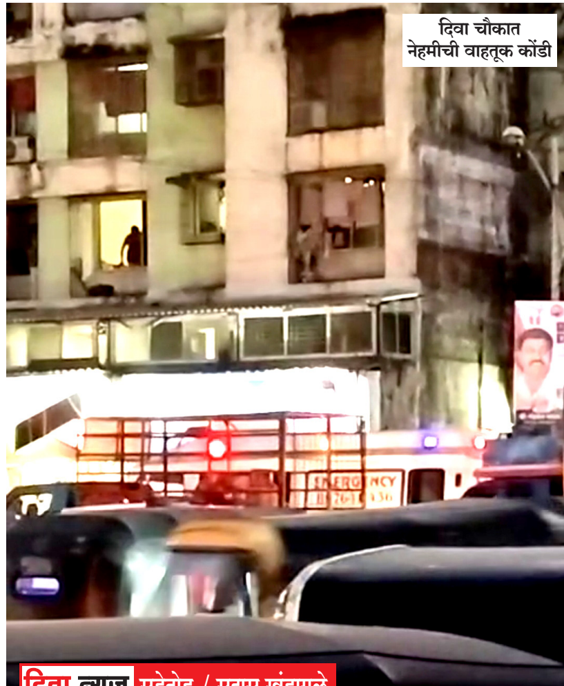
दिव्या चौकात नेहमीची वाहतूक कोंडी

फुटपाथ चालण्यासाठी आणि रस्ते वाहनांसाठी असतात. रस्त्याच्या एका बाजूला पार्किंग की दोन्ही बाजूला फेरीवाले बसवायचे... प्रशासन