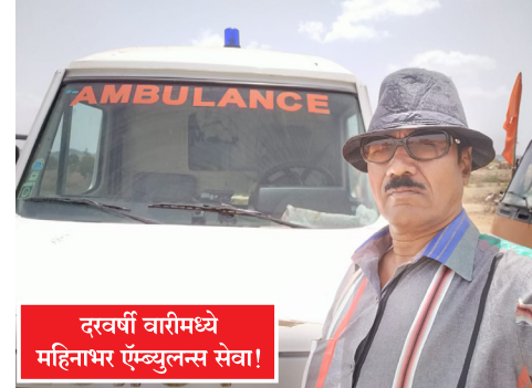
दरवर्षी वारीमध्ये महिनाभर ँम्बुलन्स सेवा!