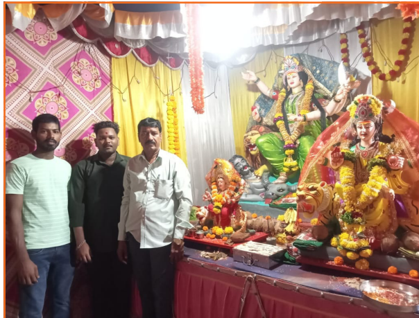
दिवा विकास प्रतिष्ठान पुरस्कृत सेवासंघ मित्र मंडळ (मुंब्रा देवी कॉलनी रोड, दिवा)