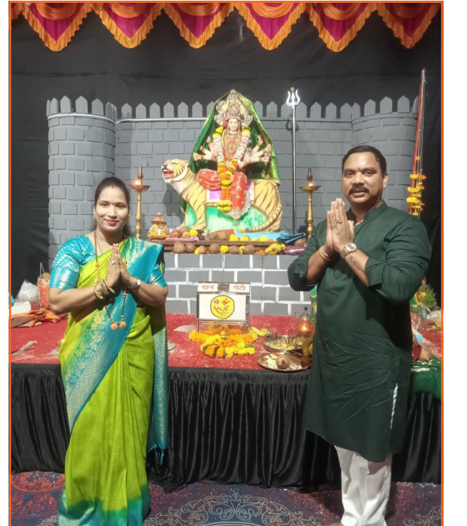
साबे गावात राजे प्रतिष्ठान आयोजित मंडळाच्या नवरात्री उत्सवातील विराजमान दुर्गा माता!