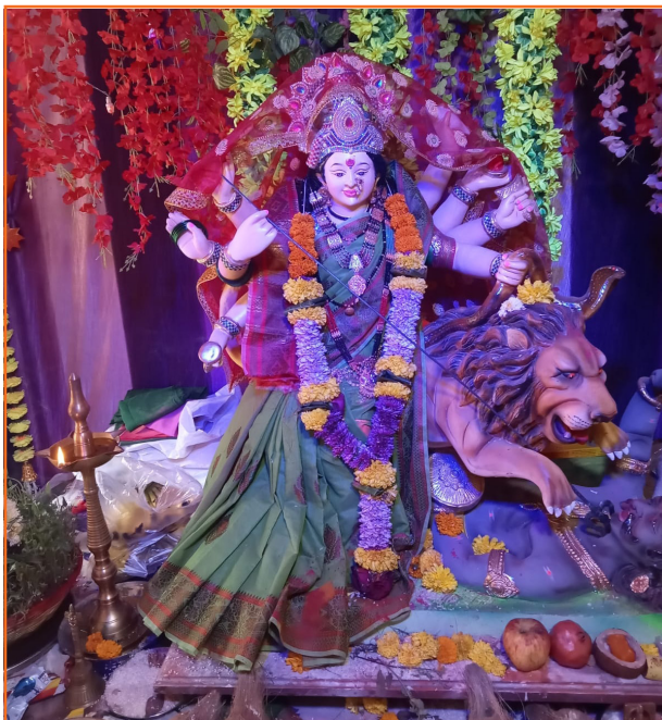
ॐ श्री साईलीला मित्र मंडळ (गुरुदर्शन नगर, मुंब्रा देवी कॉलनी रोड, दिवा-पूर्व)