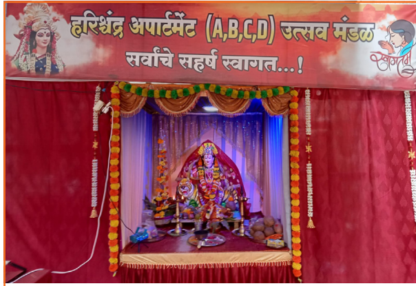
हरिश्चंद्र अपार्टमेंट (A,B,C,D) उत्सव मंडळ सर्वांचे सहर्ष स्वागत...! हरिश्चंद्र अपार्टमेंट बिल्डिंग नं. ए-बी-सी-डी (मुंब्रादेवी कॉलनी रोड, दिवा)