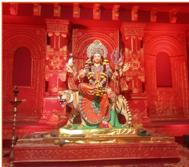
विश्वास सामाजिक संस्था ठाणे आयोजित नवरात्रोत्सव २०२३ (ठाणे)