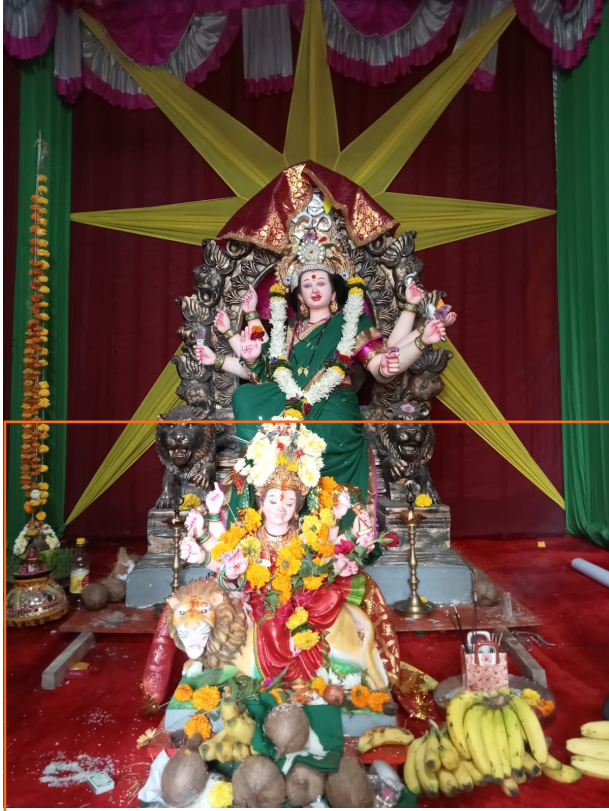
नवदुर्गा मित्र मंडळ (मुंब्रा देवी कॉलनी रोड, दिवा-पूर्व)

दिव्यातील विविध मंडळातर्फे आयोजित नवरात्री उत्सवात विराजमान दुर्गामाता!