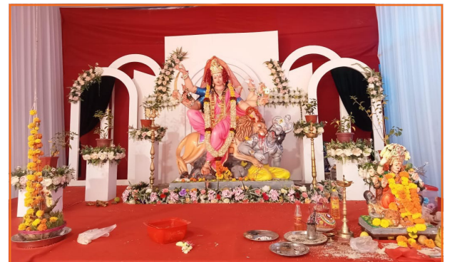
सार्वजनिक नवरात्रोत्सव मंडळ (दळवी नगर, दातिवली दिवा-आगासन, दिवा)