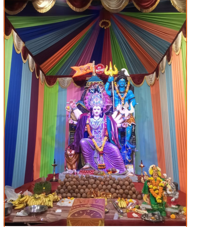
उत्तर भारतीय मंडळ (मुंब्रादेवी कॉलनी रोड, दिवा)