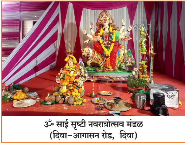
ॐ साई सृष्टी नवरात्रोत्सव मंडळ (दिवा-आगासन रोड, दिवा)