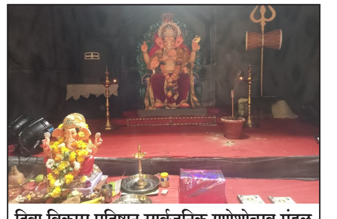
दिवा विकास प्रतिष्ठान सार्वजनिक गणेशोत्सव मंडळ येथे विराजमान झालेले गणपती बाप्पा