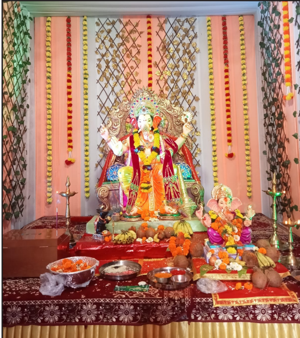
जय गणेश मित्र मंडळ. मुंब्रादेवी कॉलनीचा राजा