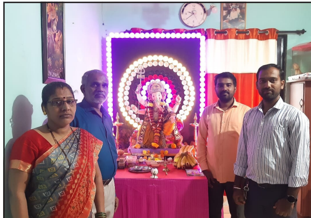
आई जीवदानी सोसायटी, मुंब्रादेवी कॉलनी.