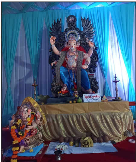
मुंब्रादेवी मित्र मंडळ. मार्केटचा महाराजा, विष्णू दादा आपारमेंट मुंब्रा देवी कॉलनी रोड दिवा