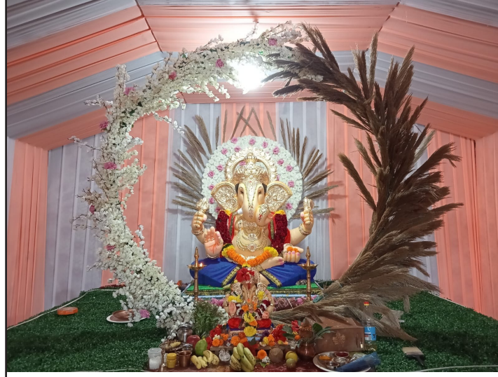
गणेश पाड्याचा राजा, ( दिवा)