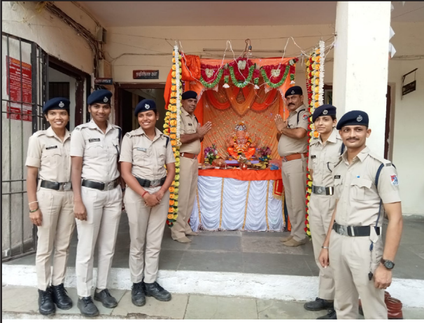
दिवा आरपीएफ येथे विराजमान झालेलेबाप्पा