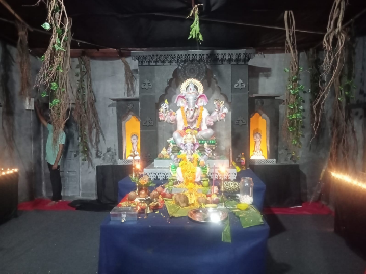
सिद्धिविनायक मित्र मंडळ.