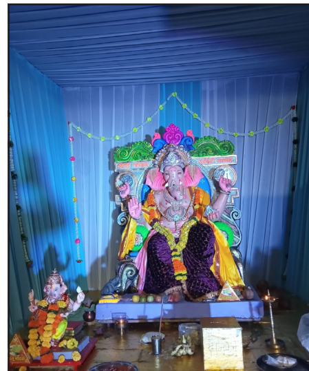
सुरेश दादा मित्र मंडळ. सुरेश नगरचा राजा, सुरेश नगर दिवा पूर्व.