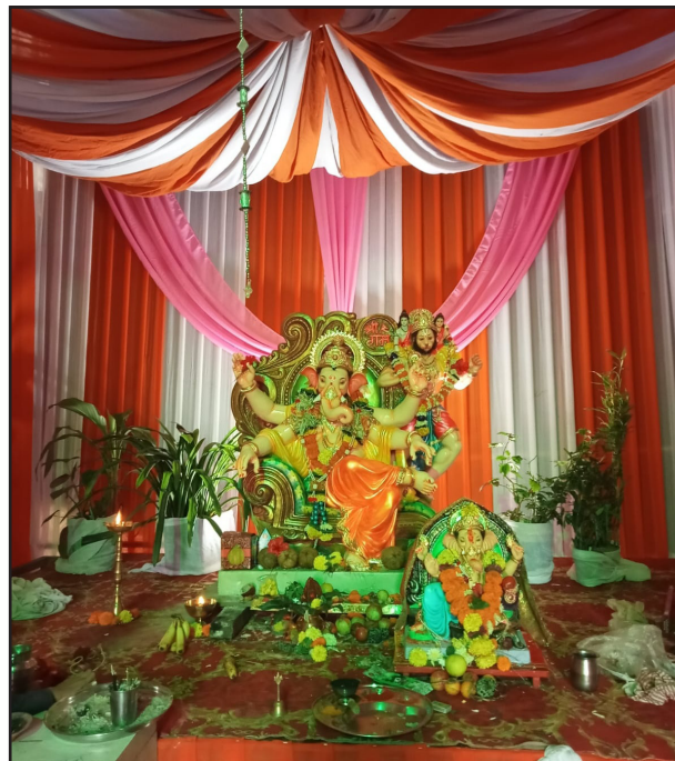
नवतरुण गणेश मित्र मंडळ. श्लोक नगर, दिवा.