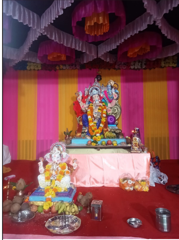
श्री साईनाथ मित्र मंडळ. सिद्धिविनायक गेट जवळ दिवा आगासन रोड दिवा