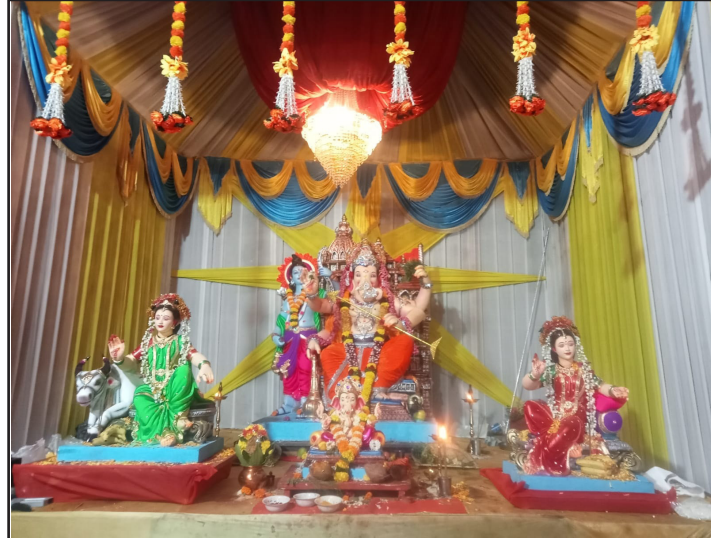
शिवसृष्टी मित्र मंडळ, बी .आर. नगर रोड दिवा (पूर्व)