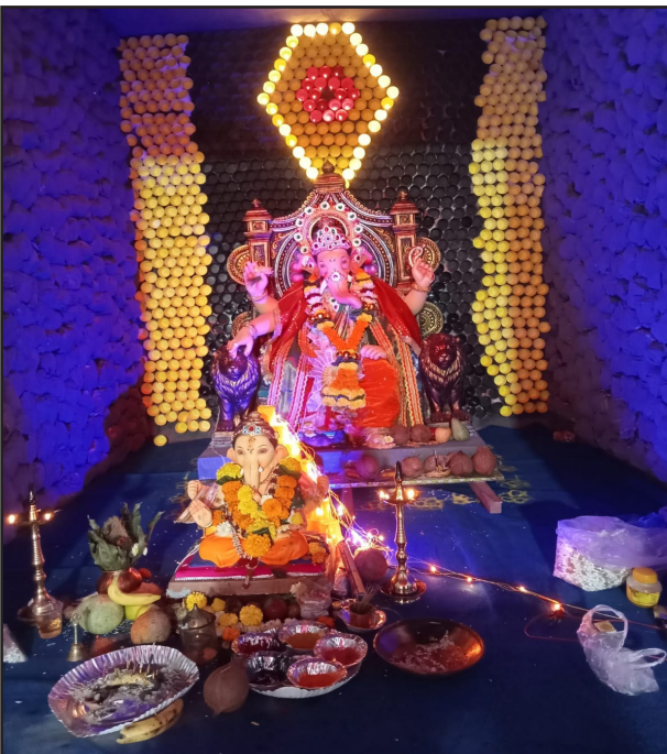
श्लोक नगर सार्वजनिक गणेशोत्सव मंडळ.