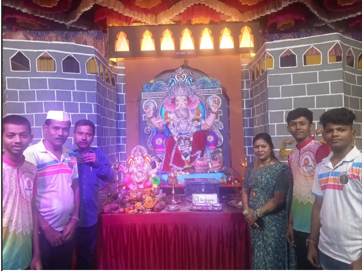
सखाराम कॉम्प्लेक्स सार्वजनिक गणेशोत्सव मंडळ. लो प्राईज सुपर मार्केटच्या बाजूला दिवा आगासन रोड (दिवा)