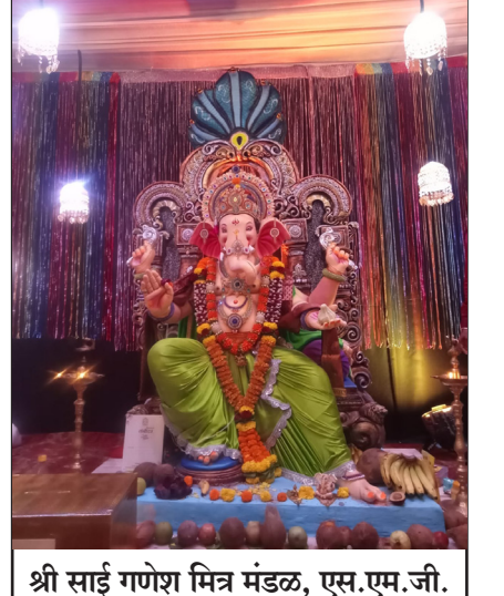
श्री साई गणेश मित्र मंडळ, एस.एम.जी. स्कूल दिवा -आगासन रोड दिवा.