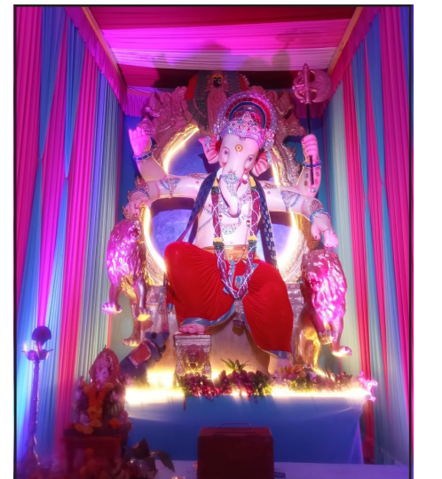
दिव्याचा महाराजा. वक्रतुंड सार्वजनिक मित्र मंडळ, वक्रतुंड नगर, दिवा.