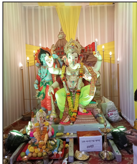
जय मल्हार सार्वजनिक मित्र मंडळ. गणेश नगर, आगासन रोड दिवा.